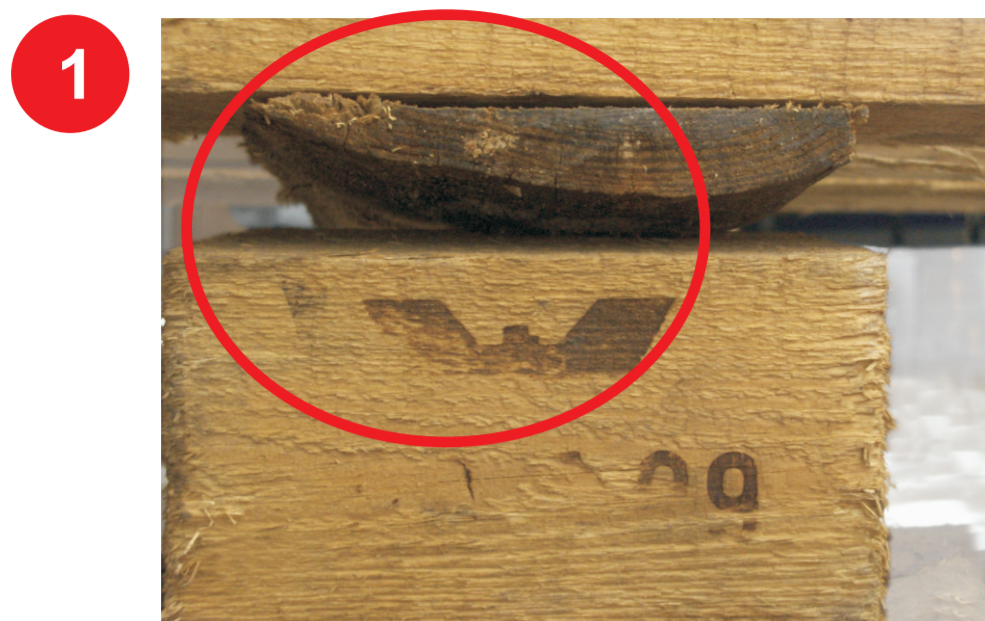
Oflis (oblina, odłupanie) wzdłużnic (środkowej i bocznych)