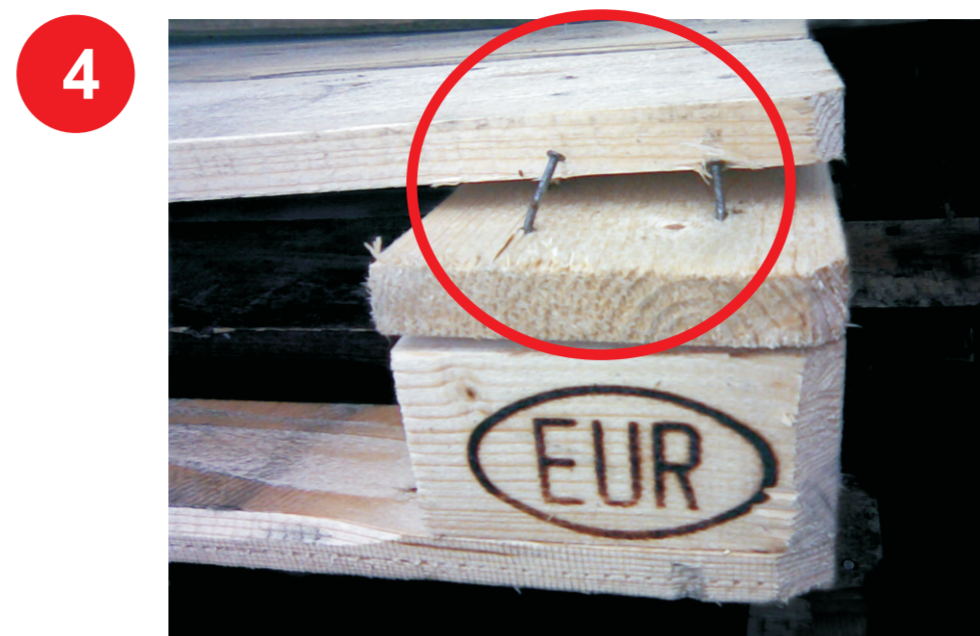
Deska z odłupaniem ukazującym dwa lub więcej gwoździ.