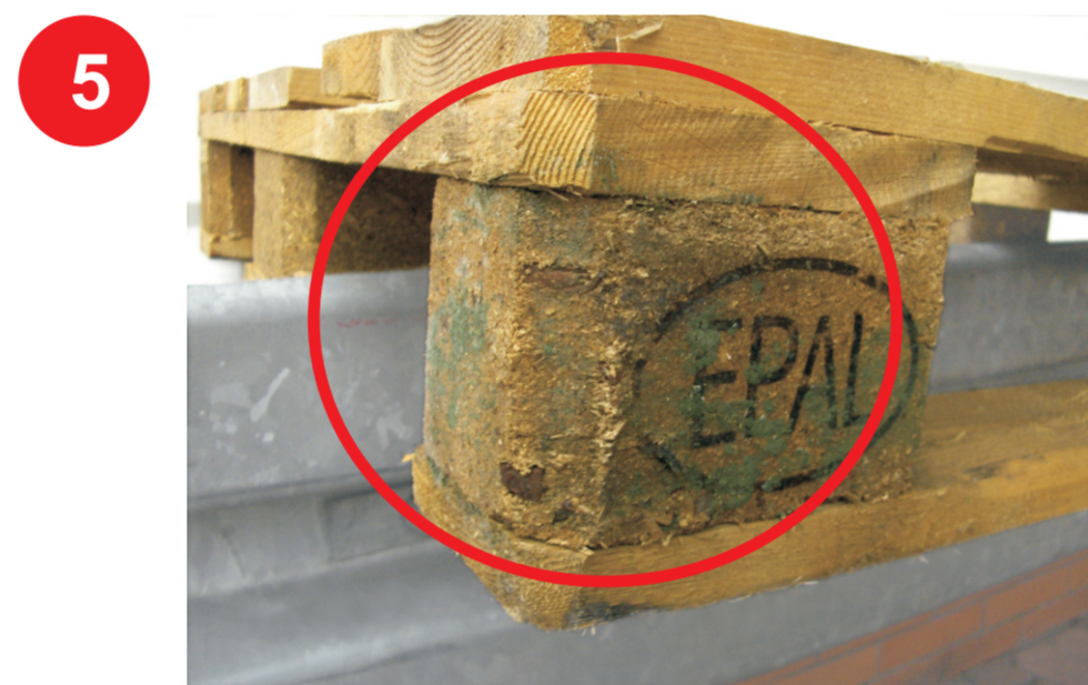
Ślady zbutwienia, zagrzybienia bądź próchnicy. Takie palety należy poddać utylizacji.