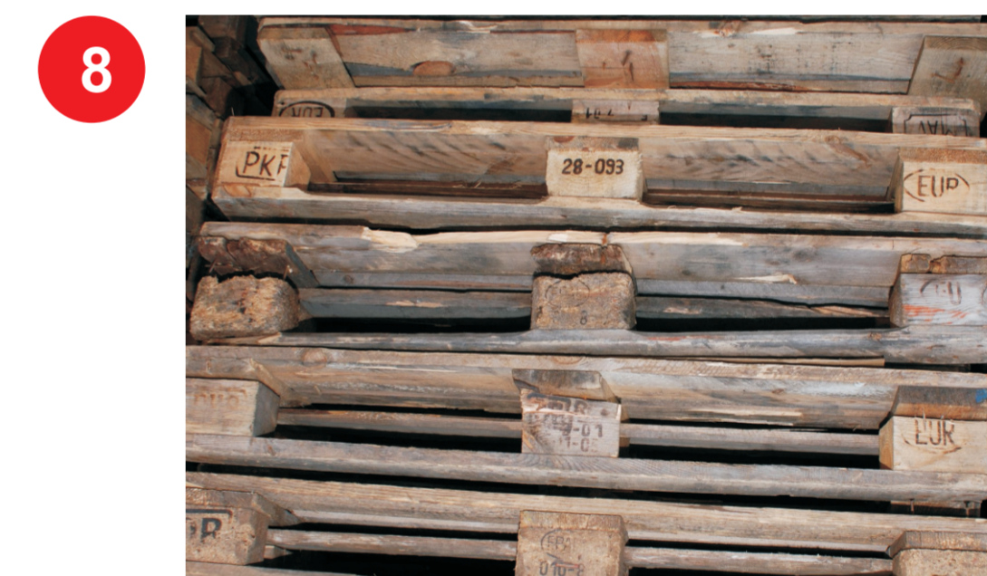
Ogólnie zły stan techniczny, np.: - trwałe zanieczyszczenie (np. olej, cement, smar); - wykorzystanie niedopuszczalnych elementów konstrukcyjnych - desek, wsporników, gwoździ; - złe pozycjonowanie elementów, np. wspornik przesunięty względem desek.