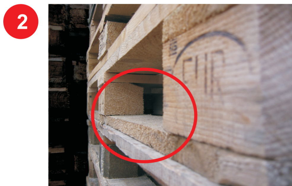
Brak frezów na górnych krawędziach desek dolnych.