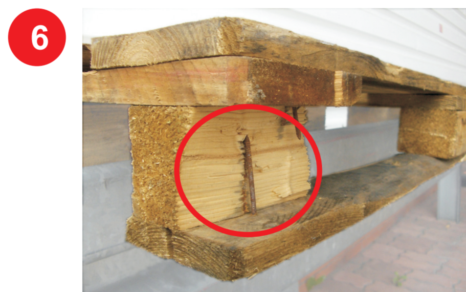
Wspornik z odłupaniem ukazującym choćby jeden gwóźdź

Palety z wadami niedopuszczalnymi można naprawić (jeśli to możliwe) lub poddać utylizacji.