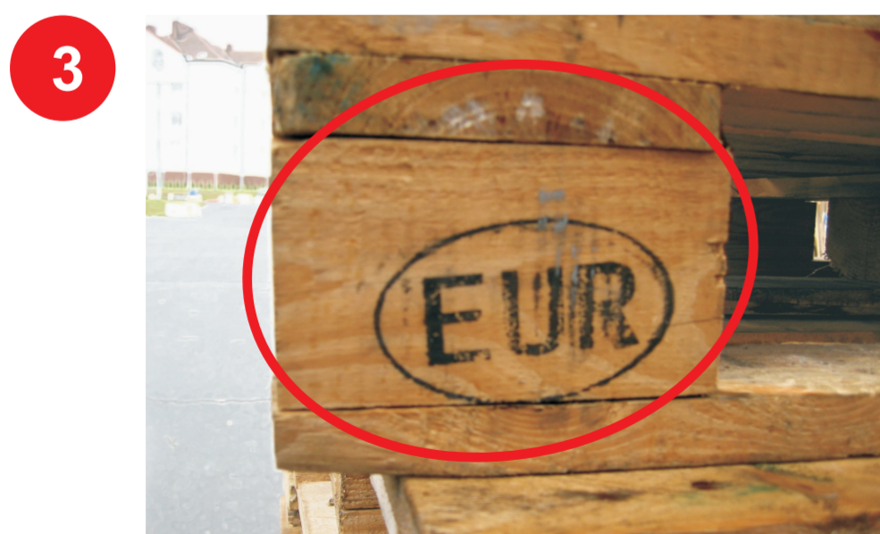
Nieprawidłowe oznakowanie na wspornikach.